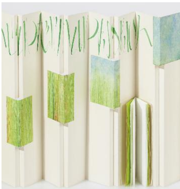
Angelika Maier, Leporello „Grashüpferhupf“, 2012, 26,4 x ca. 50 cm, Colapen, Gouache, Buntpapiere mit Kleister und Papierfarben (Detail)

Kooperation mit der Katholischen Erwachsenenbildung KEB im Bistum Passau e.V.