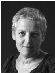
Bernadette Maier

Ausstellungsdauer: 5. Mai – 16. Juni 2017